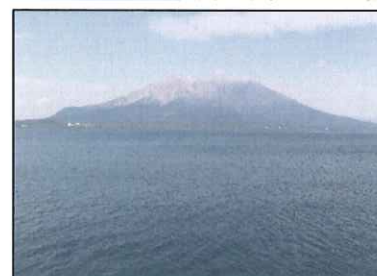
鹿児島県のシンボル「桜島」