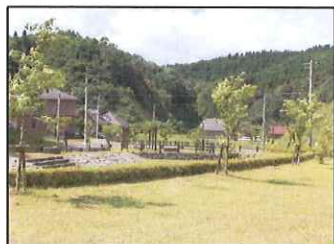
山里の分譲地 ロイヤルシティ霧島妙見台

当日は鹿児島県「かがしま移住相談会」を同時開催！ 15:00~16:00(予定) 主催:鹿児島県かがしま遊楽館(移住相談窓口)